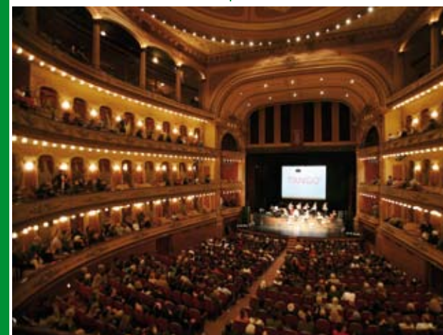
Teatro Avenida en la velada de apertura.