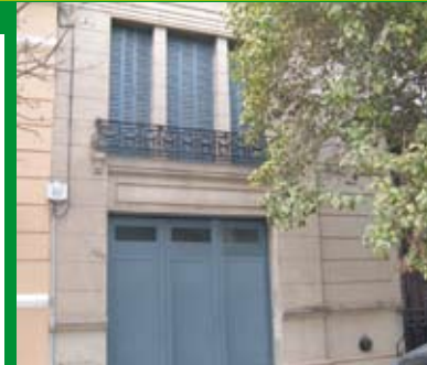
Fachada de la nueva casa AADI.

Es por ello, que vamos a festejar los cuatro años, con una muy buena noticia: los músicos cordobeses tienen su nueva casa. Y vamos por más. ¡¡¡Felicitaciones!!!