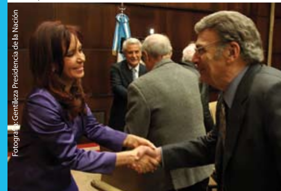
Leopoldo Federico saluda a la Presidenta de la Nación.