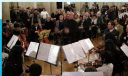
La Orquesta de Niños de la Villa 31 ofrece su música al maestro.