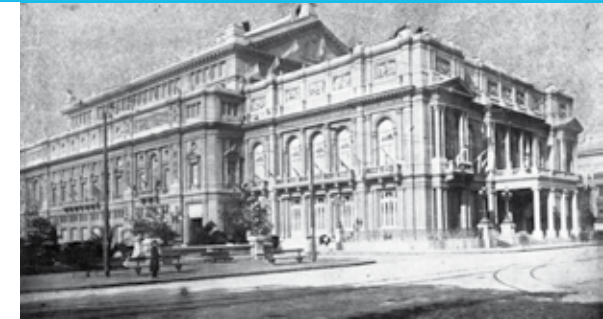
En Teatro Colón en sus primeros años.

La planta del nuevo teatro presenta una forma rectangular: 115 metros de largo por 60 de ancho, y una altura de casi 30 metros. Su superficie total alcanza los 20.500 metros cúbicos, en forma de herradura, característica arquitectural de los teatros