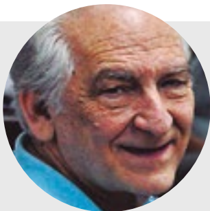
POCHO ROCH (1939-2017)

El 9 de Julio llegó la noticia desde Cuba. Había partido un hijo dilecto de Mendoza, que pasó la vida repartiendo sus versos y sus canciones. Fue poeta, juglar y, ante todo, un referente de la música popular argentina y latinoamericana. En 1976 salió de su Guaymallén natal para radicarse en Buenos Aires, donde se desempeñó como periodista. En 1983 editó su primer disco: Como un gran viento que sopla . Sus obras "Este Manuel que yo canto" (dedicada a Manuel J. Castilla) y "Coplas de la libertad" (con versos de Daniel Giribaldi) ya forman parte de nuestra más querida y celebrada tradición. Se consagró como trovador con dos obras fundamentales: "Los obreros de Morón" y "Cebollita y huevo". Recientemente, había recibido distinciones de la Legislatura de Mendoza, de la Secretaría de Cultura de la Provincia y de la Municipalidad de Guaymallén que, para su cumpleaños 70, declaró Patrimonio Cultural la casa donde nació. De vuelta en su tierra, el Salón de los Pasos Perdidos de la Legislatura de Mendoza fue el lugar donde sus familiares y amigos lo despidieron con canciones.