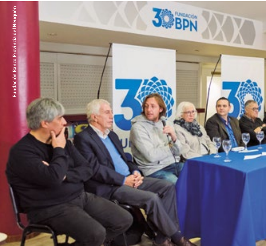
Fundación Banco Provincia del Neuquén