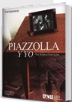
Fragmento del libro El Tano y yo , de Horacio Malvicino, capítulo "Polémicas y travesuras", pág. 55