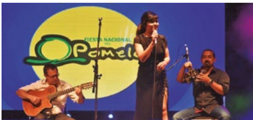
Facebook Fiesta Nacional del Pomelo