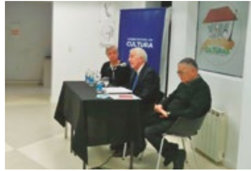
Reunión de nuestras autoridades con intérpretes de la zona.

EN EL MARCO DE LA VELADA, NUESTRAS AUTORIDADES REIVINDICARON, UNA VEZ MÁS, EL DERECHO DE INTÉRPRETE.