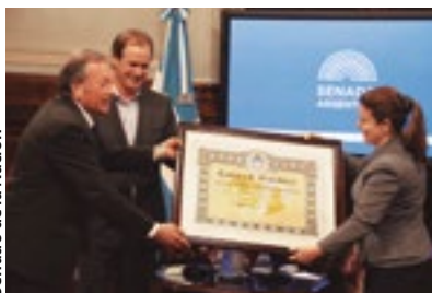
Senado de la Nación

comunicación, en el campo de la investigación histórica, creación literaria, composición musical y dirección teatral, recibiendo diferentes premios por su prolífica labor.