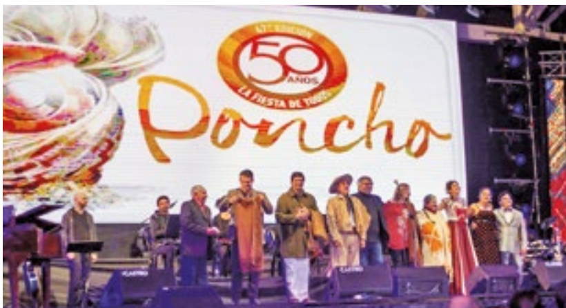
Facebook Fiesta Nacional del Poncho

Con letra de Kique Sánchez Vera y música de René Vargas Vera, la "Zamba para mi Poncho" obtuvo el primer premio y fue cantada en la ceremonia inaugural, para luego quedar registrada en el disco Para mi poncho . El poema de Kique (fallecido el 1 de febrero de 2010) inspiró al periodista, escritor y compositor Vargas Vera para lograr la música cálida y precisa que el fino arte del poncho catamarqueño requería.