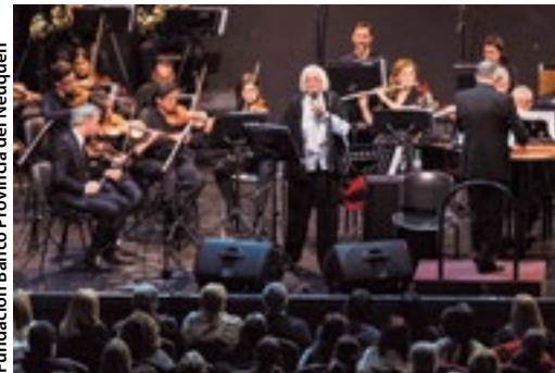
Fundación Banco Provincia del Neuquén