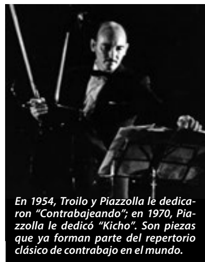
En 1954, Troilo y Piazzolla le dedican "Contrabajando"; en 1970, Piazzolla le dedicó "Kicho". Son piezas que ya forman parte del repertorio clásico de contrabajo en el mundo.