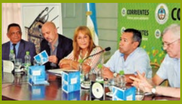
Instituto de Cultura de Corrientes

Como todos los años, AADI, junto con el Instituto de Cultura de Corrientes, hizo entrega del CD grabado por los ganadores de los certámenes Pre Fiesta Nacional del Chamamé, en su edición 2016.