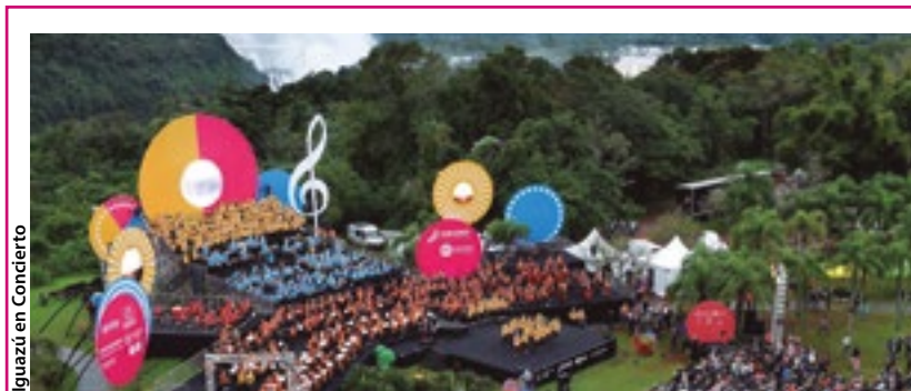
Iguazú en Concierto

Ya constituida como Fundación Grillos, son un ejemplo en la formación integral de niños y jóvenes. Su modelo de gestión impulsó la creación de los Centros de Educación Musical -CEMU- con veinticuatro nodos orquestales, veinte coros y más de dos mil alumnos en todo el interior, dependientes del Consejo General de Educación de la provincia de Misiones.